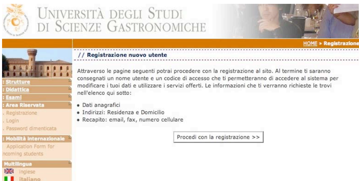
Fig. 3 – Finestra iniziale per la registrazione di un nuovo utente

W Se non sei un utente registrato: seleziona la voce “Registrazione” posta sotto la sezione “Area riservata” dal Menu di sinistra. Si aprirà la seguente maschera (Fig. 3).