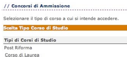
Fig. 8 – Finestra per la scelta del Corso di Studio

Nella pagina successiva devi scegliere la tipologia di concorso al quale vuoi iscriverti (Corso di Laurea - Fig. 8).